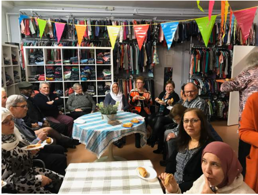
Etentje bij KLESTEO

Na de receptie hebben wij in onze eigen locatie een gezellig etentje gehouden met vrijwilligers en bestuur.